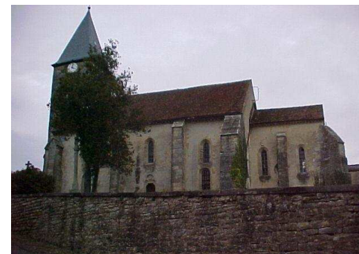
L'église de Darcey, en Bourgogne, qui date du XIIIe siècle

Nicolas Perrot s'installe à Bécancour vers 1675. Ses nombreux voyages dans l'Ouest et aux États-Unis, ne l'empêchent pas de fonder un famille; il aura 11 enfants. Il décède à Bécancour le 13 août 1717 dans l'oubli et la pauvreté.