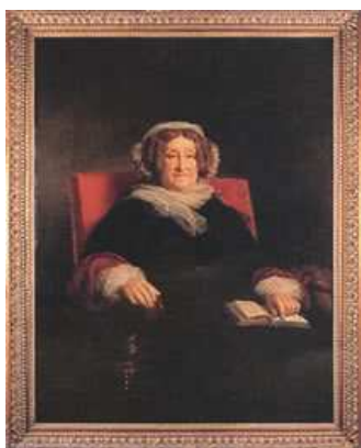
Portrait de la Veuve, par Léon Cogniet

Qui est donc cette Dame qui a donné son nom à l'un des plus prestigieux champagne de France? Pouchkine a écrit sur elle : « Napoléon a dormi sous son toit. L'empereur Alexandre a bu son vin ».